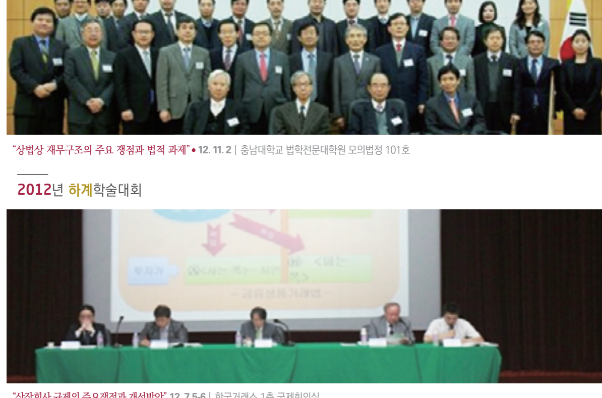
「최근 주요 상사법회의의 쟁점」 • 14. 2. 14 | 한양대학교 제3법학관 102호